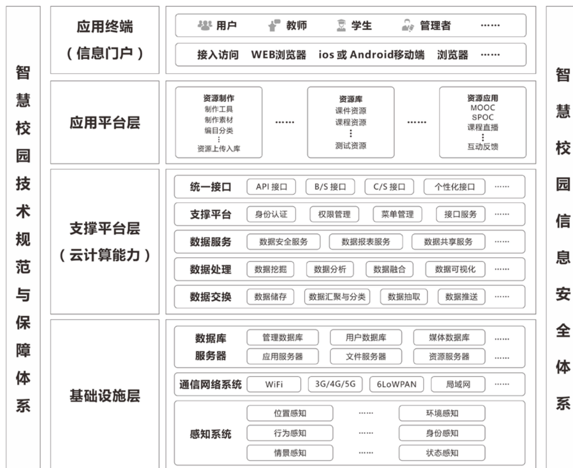
图3 智慧教学资源总体架构

按私有云独立部署的智慧教学资源总体架构如图3所示，从逻辑上分为：基础设施层、支撑平台层、应用平台层和应用终端。此外，信息安全体系也是其重要组成部分。