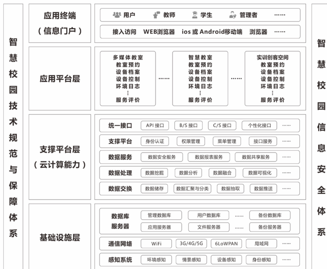
图2 智慧教学环境总体架构