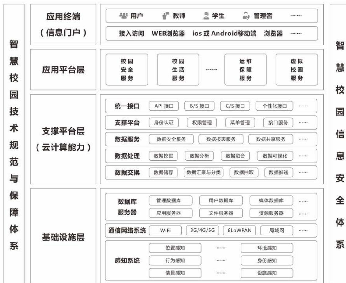
图5 智慧校园服务总体架构

按私有云独立部署的智慧校园总体架构如图5所示，从逻辑上分为：基础设施层、支撑平台层、应用平台层和应用终端。此外，信息安全体系也是其重要组成部分。