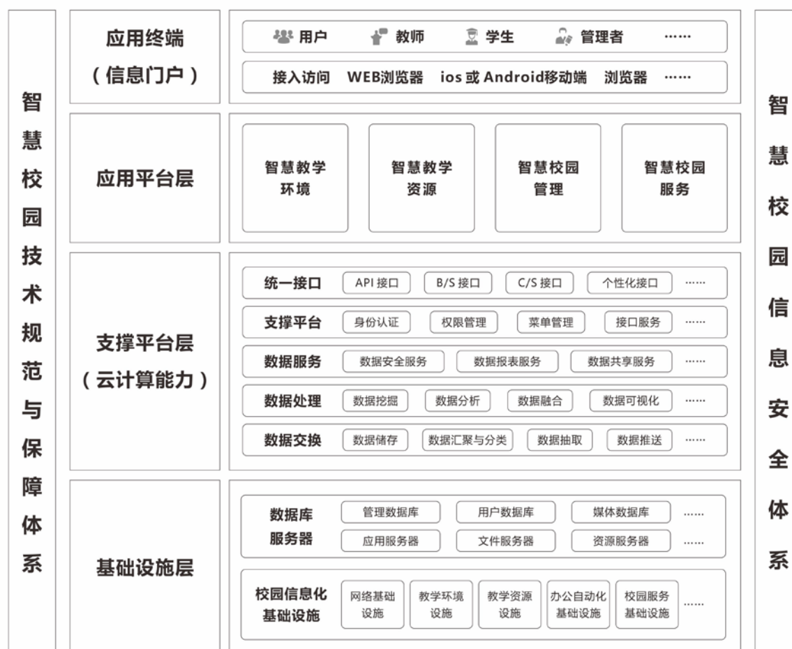
图1 智慧校园总体框架

智慧校园总体框架宜采用云计算架构进行部署，如图1所示，从逻辑上分为：基础设施层、支撑平台层、应用平台层和应用终端。此外，信息安全体系也是其重要组成部分。